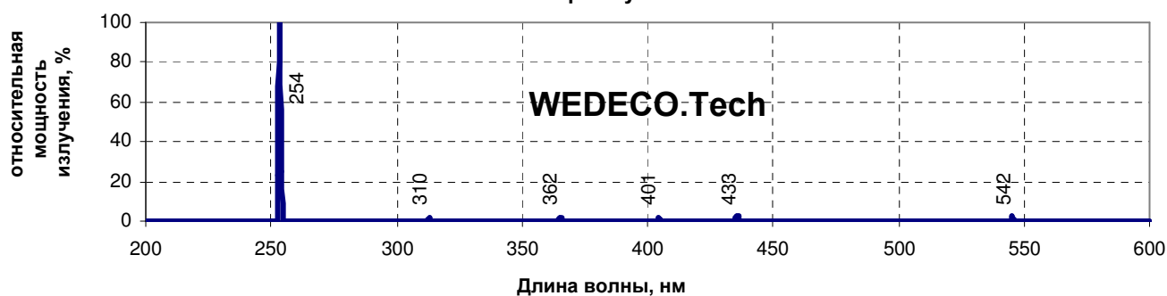
Спектр излучения лампы